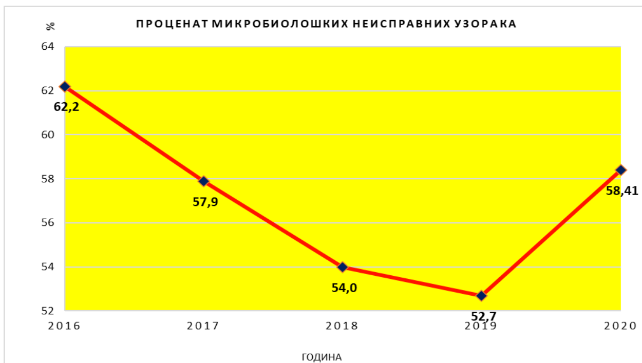
Графикон 4. Процент микробиолошке неисправности површинских вода које се користе за водоснабдевање у Републици Србији у периоду од 2016. до 2020. године