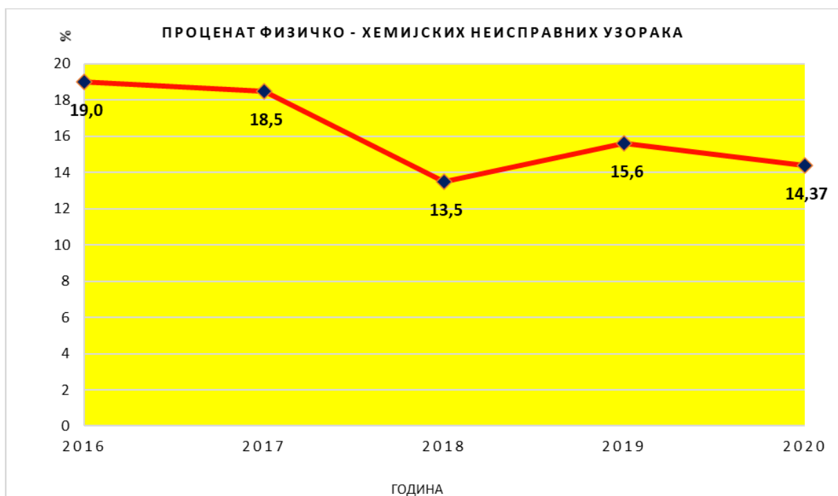
Графикон 1. Процент физичко-хемијске неисправности површинских вода које се користе за рекреацију у Републици Србији у периоду од 2016. до 2020. године

Извор података: институти/заводи за јавно здравље